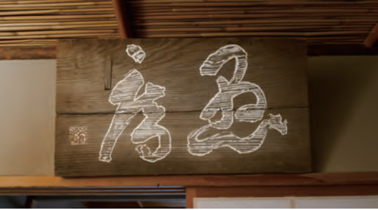
ホテルの茶室に飾られている「愚庵」の扁額