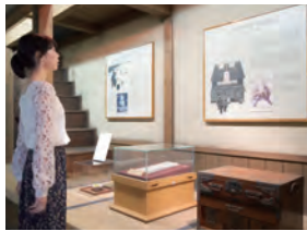
御木本幸吉記念館