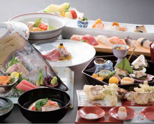
春の御食つ国会席