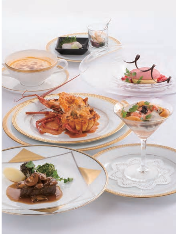
ランチ クロニクル