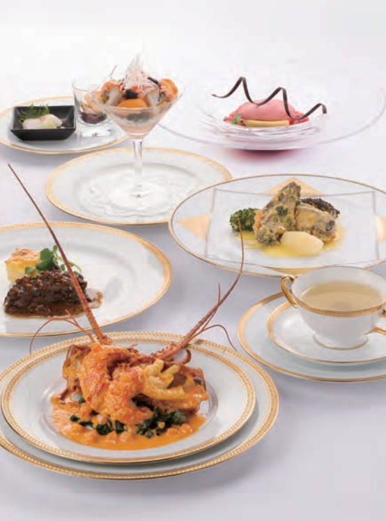
ディナー クロニクル