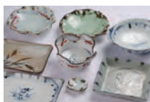
廣永窯の器(鉄板焼き「山吹」)

自体も戦時中に村野が設計。資材難で建築が危ぶまれるなか、半泥子は所有する山林から木材を寄付しました。後に村野は設計した集会所がホテルへと姿を変えたことを「何より嬉しかった」と述べ、半泥子への感謝の言葉を書き残しています。木材は時を経て、今も「ザクラブ」で使われ、温かな雰囲気醸しています。また機知に富んだ半泥子はその一角にある茶室を「賢島」を逆手にとった「愚庵」と命名したと伝えられており、揮毫された扁額が茶室上がり口に残されています。ザクラブにある鉄板焼きレストラン「山吹」では、半泥子廣永窯の器を使い、ご縁を大切に伝え続けています。今回は半泥子の足跡を辿るため、生涯を過ごした津市にある石水博物館、ギャラリー・仙鶴、半泥子廣永窯を巡ります。