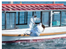
一時間に一回行われている海女の実演