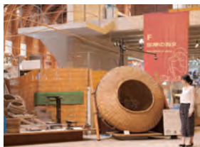
昔の漁具などの展示