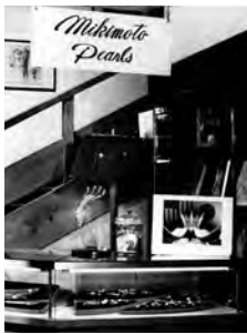
ホテルには開業当時からミキモトショップが存在

かけがえのない時間を過ごすためという方が多くいらっしゃいます。お客様の「想い」「ご期待」にお応えできるよ