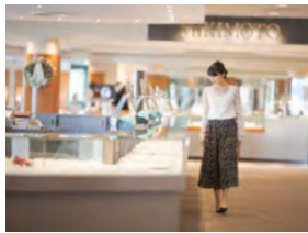
プラザには多くのジュエリーが並ぶ

2021年3月～5月、入場口で志摩時間春号(本誌)を提示すると、1組5名様まで入場料が無料となります。