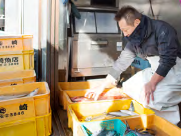
捕れたての魚が店頭に並ぶ岩崎魚店