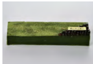
5月2日 伊勢茶のテリーヌ

料 金 ¥3,500 販売数 各40個限定 ※販売数に達し次第終了 時 間 11:00~18:00 販 売 ザクラシック1階 ショップ ※店頭受け取り限定商品