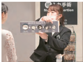
真珠の養殖過程の解説