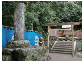
島内にある神社「珠の宮」