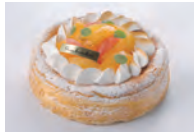
4月4日 柑橘のチーズケーキ