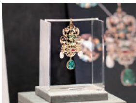
歴史的価値の高い真珠の装飾品などの展示