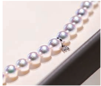
厳しい基準をクリアして完成するミキモトクオリティ。さりげなく添えられる「M」のチャーム

ることになりました。「養殖真珠誕生の地」がここにあり、この伊勢志摩の自然がなければ生み出されなかったものだと思っています。真珠を専門に扱った国内初の博物館をはじめとする施設で広く真珠の知識や魅力を国内外に発信しています。そして商品についても厳