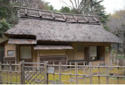
半泥子廣永窯にある「山里茶席」