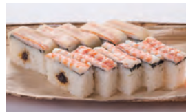
4月11日 車海老の押し寿司 ¥5,000

販売数 各30個限定 ※販売数に達し次第終了 時 間 11:00~18:00 販 売 ザクラシック1階 ショップ ※店頭受け取り限定商品