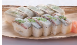
3月14日 伊勢またいと穴子の押し寿司 ¥4,000

和食総料理長 塚原巨司が三重の様々な食材を目にも楽しく、味わい深い押し寿司、棒寿司に仕上げました。