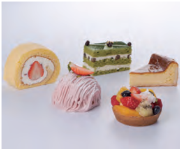
ケーキセット ¥1,875 11:30～17:30

イチゴクリームのモンブランは、中にクリームブリュレやピスタチオクリーム、イチゴジャムと生のイチゴを入れることで、イチゴの酸味と甘味を愉しめます。上品な甘さのホイップクリームがたっぷり詰まったロールケーキ、伊勢茶のケーキ、季節のフルーツタルトなど、色とりどりのケーキをご用意しています。