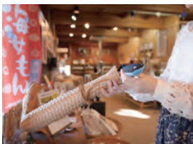
ユニークなうなぎのぬいぐるみ人形