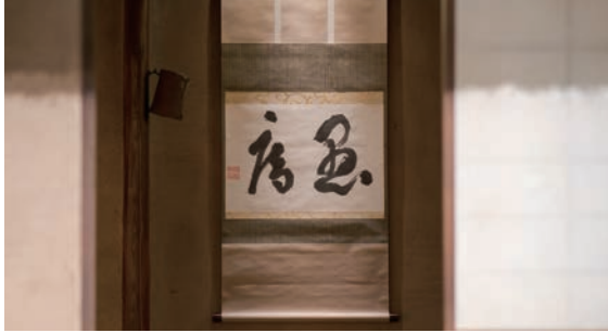
石水博物館に保管されている「愚庵」の書軸