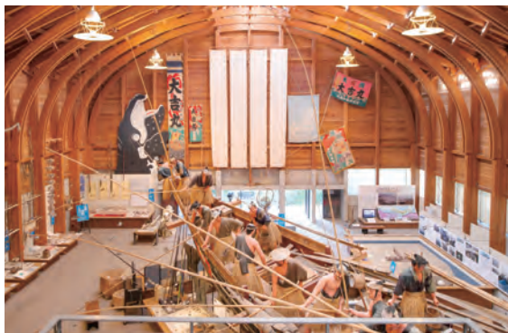
カツオの一本釣り漁の様子を再現