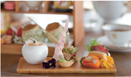
開業70周年記念アフタヌーンティー ¥4,800 11:30～17:30 ※要予約（前日 17:30まで）

リッタータなど変化に富んだ多彩な味わい。桜の花をパウダー状にした美しい色合いのチップなど、春を感じるプレートに仕上げました。