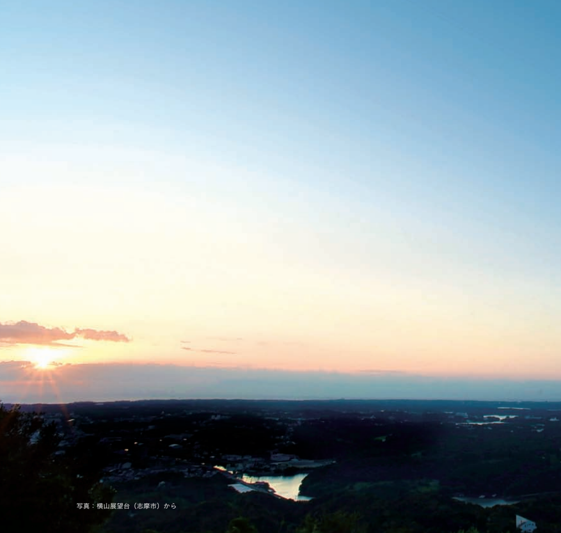
写真：横山展望台（志摩市）から