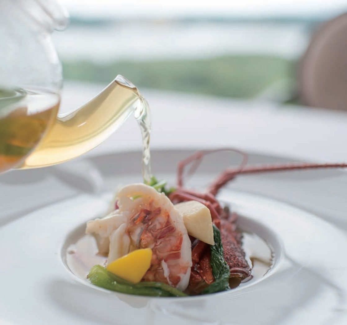
アバンタージュ (¥18,500) 伊勢海老のポトフ仕立て