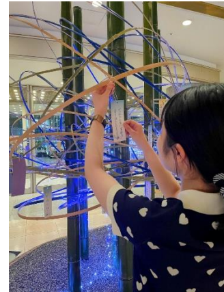
短冊参加 イメージ