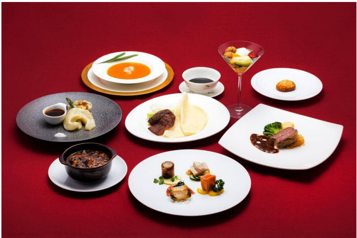
中国料理 四川 35 周年記念ペアコース

<本件に関する報道関係各位からのお問い合わせ先> 都ホテル 四日市 セールス&マーケティング部 〒510-0075 三重県四日市市安島 1-3-38 TEL：059-355-2806 FAX：059-352-4163