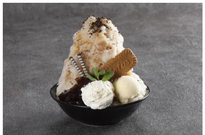
アイスアフォガードかき氷