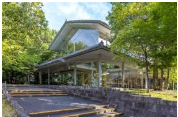
Café 檀乃杜 外観