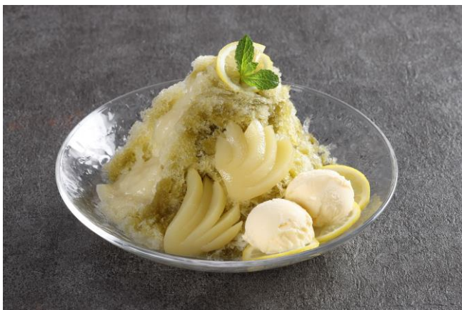
ピーチグリーンティーかき氷

エスプレッソのほろ苦さが広がるかき氷。中には二層の練乳を忍ばせ、食べ進めるたびにやさしい甘さが広がります。仕上げにふりかけた粗挽きコーヒー豆の苦みもトッピングのバニラアイス、ホイップクリーム、コーヒーゼリーとともに楽しみください。