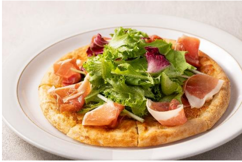
4種のチーズピザ 生ハム添え ￥2,200