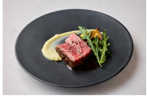
博多和牛ロースのグリエ（100g） ￥7,000