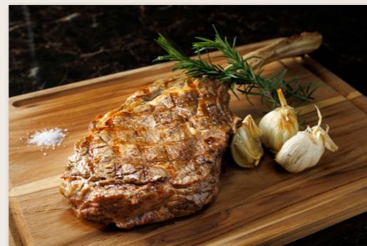
メキシコ産トマホークステーキ 1P ¥10,000 Mexican Beef Tomahawk