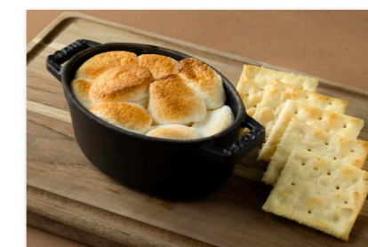
マシュマロと ¥1,500 チョコレートのスモア S'more (Marshmallow and Chocolate served with Crackers)