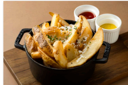
フライドポテト トリュフ&チーズ ¥1,000 Truffle and Cheese Fries