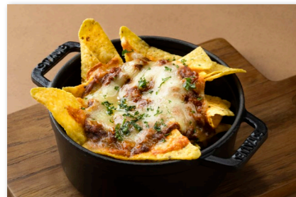
ナチョス ¥1,500 Nachos