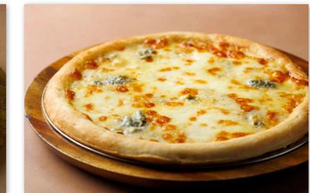
クワトロフォルマッジ ピザ ¥2,500 Pizza Quattro Fromaggi