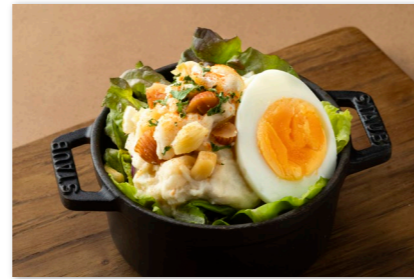
ナッツと燻製チーズの ポテトサラダ ¥1,000 Potato Salad with Mixed Nuts and Smoked Cheese