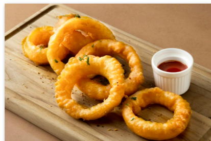
オニオンリングフライ ¥1,000 Fried Onion Rings