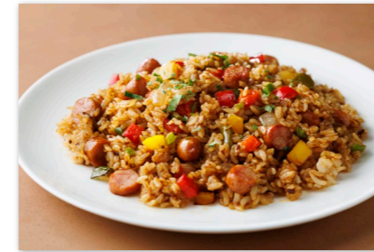
ソーセージのジャンバラヤ ¥2,000 Sausage Jambalaya