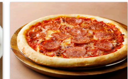
ペパロニ ピザ ¥2,000 Pizza Pepperoni