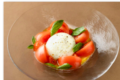
ブルラータチーズと トマトのカプレーゼ ¥2,000 Burrata with Tomato and Basil

本日の前菜盛合せ (スタッフにお尋ねください) Assorted Appetizers ¥3,000