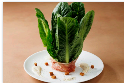
シーザーサラダ ¥2,000 ハモン・セラーノ添え Caesar Salad with Serrano Ham