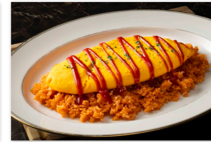
ジャンボオムライス ¥2,000 Jumbo Rice Omelette