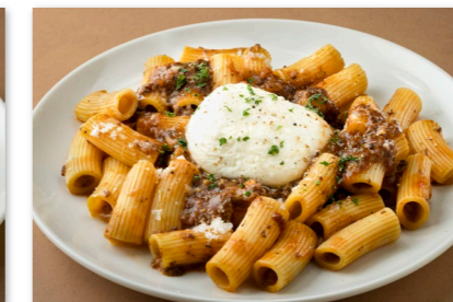
ボロネーゼ リガトーニ ¥2,500 ブルラータチーズ添え Pasta Bolognese topped with Burrata