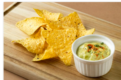
ワカモレ& トルティーヤチップス ¥1,000 Guacamole and Tortilla Chips