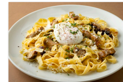
厚切りベーコンの カルボナーラ パスタ ¥2,000 Pasta Carbonara topped with Bacon