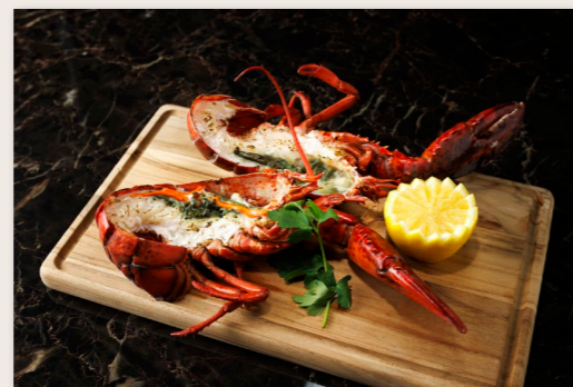
活オマール海老 1P ¥5,000 Live Lobster