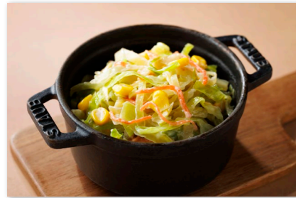
コールスロー ¥500 Coleslaw