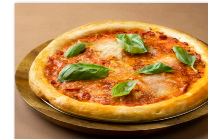
マルゲリータ ピザ ¥2,200 Pizza Margherita