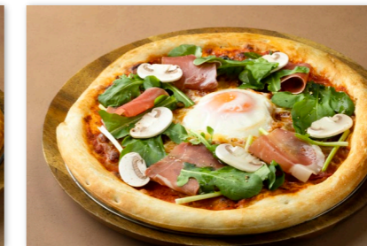
ビスマルク ピザ ¥2,500 Pizza Bismark