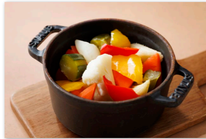
ベジタブルピクルス ¥500 Pickled Vegetables