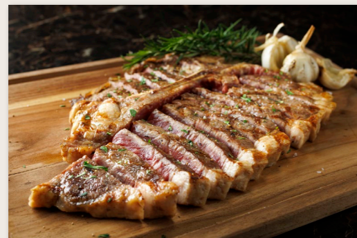
アメリカ産Tボーンビーフ 1P ¥8,000 US Beef T-Bone