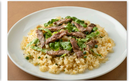
ビーフガーリックライス ¥2,500 Stir-Fried Beef and Garlic Rice