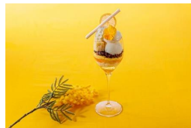
ミモザパフェ(柑橘のパフェ)