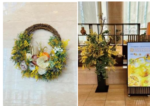
前年装飾イメージ

3月8日は「国際女性デー | 女性の生き方を考える日」として男女共にジェンダー平等について考え、アクションする日です。都ホテル 四日市では女性のエンパワーメントとジェンダー平等の社会実現をめざし、今年10周年を迎える HAPPY WOMAN® の活動に賛同し、ロビーや店舗前にてシンボルカラーのハッピーイエロー（幸せの黄色）の彩りで迎ええます。