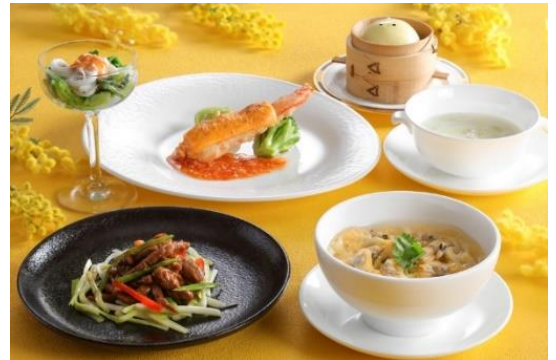
中国料理 四川 ランチコース『ミモザ』