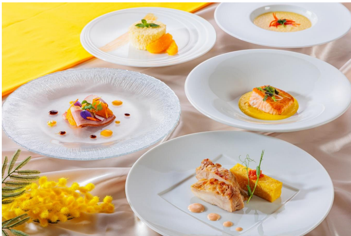
パルミエール 『ミモザコース』

＜本件に関する報道関係各位からのお問い合わせ先＞ 都ホテル 四日市 マーケティング部 〒510-0075 三重県四日市市安島 1-3-38 TEL：059-355-2806 FAX：059-352-4163