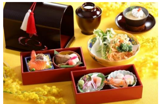
日本料理 都 花見御膳「ミモザ」