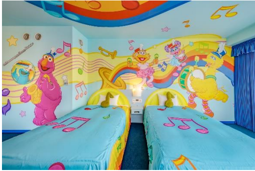
セサミストリート・マーチングバンド・ルーム

ユニバーサル・スタジオ・ジャパンとコラボレーションした、大人気のセサミストリートのコンセプトルーム「ユニバーサル・セサミストリート・デザイン・フロア」。