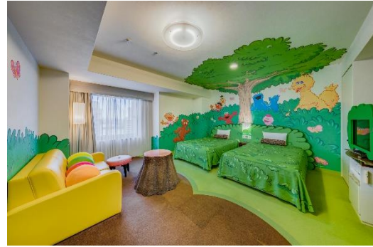
セサミストリート・ビッグフォレスト・ルーム

ご宿泊のお客さま限定特典としてお渡ししているオリジナルグッズが、25周年を記念してリニューアル！