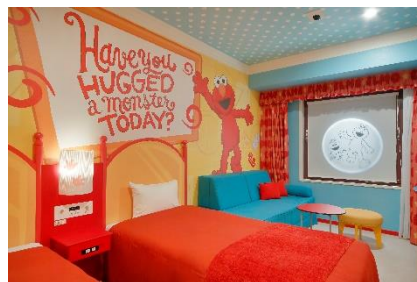
エルモのハッピー・ルーム