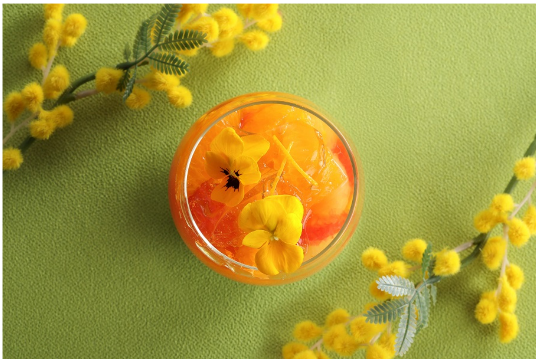
カフェ&グルメショップ カフェベル「柑橘のヴェリーヌ」