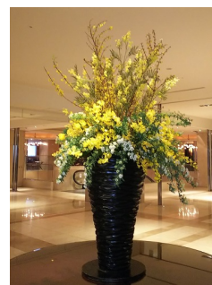
フラワー装飾イメージ

■HAPPY WOMAN®はパートナーシップで持続可能な開発目標（SDGs）を支援する活動です。