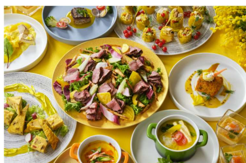
都ホテル 尼崎 レストラン アゼリア