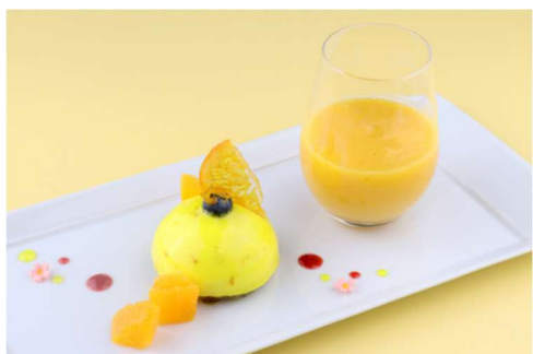
都ホテル 岐阜長良川 ラウンジ フローラ