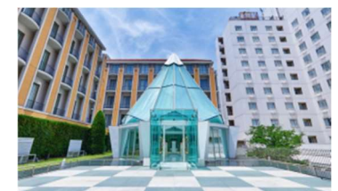
都ホテル 京都八条