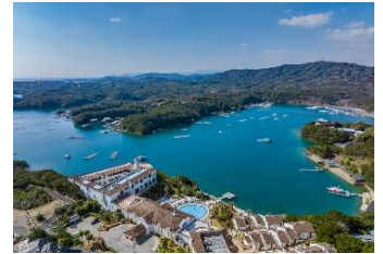
都リゾート 志摩 ベイサイドテラス