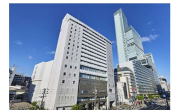
都シティ 大阪天王寺