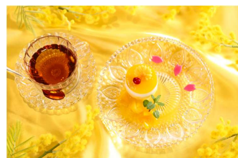
ホテル近鉄ユニバーサル・シティ レストラン「イーボック」