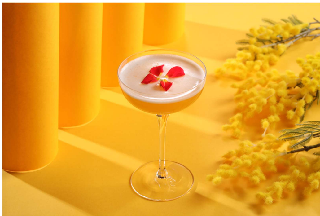
シェラトン都ホテル大阪 レストラン&ラウンジ・バー ゆう (eu)

すべての人が力を発揮でき、幸せに生きられるジェンダー平等社会実現に向けた取組みを推進し、女性の活躍を応援します。詳細は別紙をご覧ください。