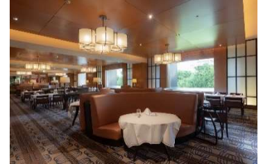
シェラトン都ホテル大阪