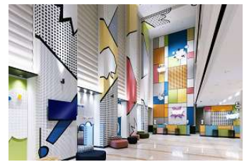
ホテル近鉄ユニバーサル・シティ