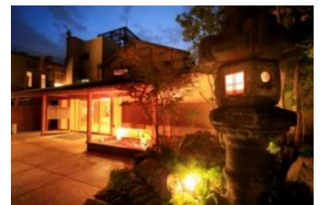
奈良 万葉若草の宿 三笠