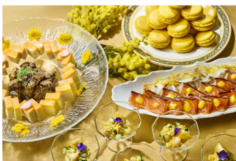
ウェスティン都ホテル京都 オールデイダイニング「洛空」