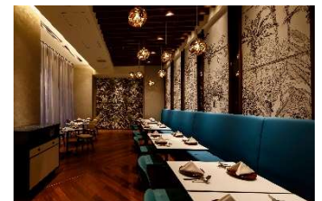
都シティ 大阪本町