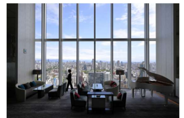
大阪マリオット都ホテル