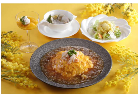
都ホテル 四日市 中国料理 四川