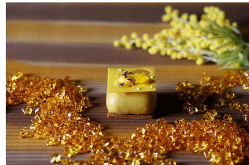
大阪マリオット都ホテル LOUNGE PLUS