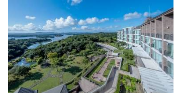
都リゾート 奥志摩 アクアフォレスト