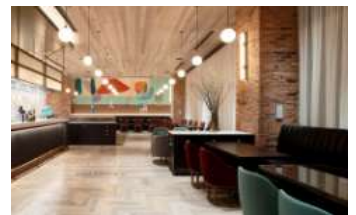
都シティ 東京高輪