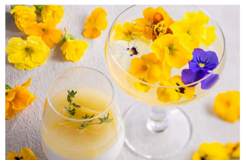
都ホテル 博多 SOMEWHERE RESTAURANT & BAR