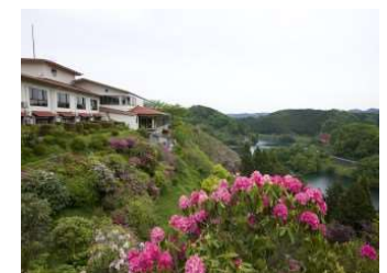
青蓮寺レークホテル

■HAPPY WOMAN®はパートナーシップで持続可能な開発目標（SDGs）を支援する活動です。