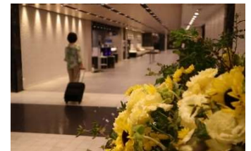
都シティ 近鉄京都駅