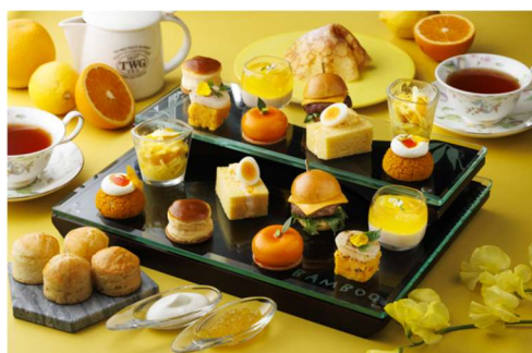
シェラトン都ホテル東京 ロビーラウンジ パンブー