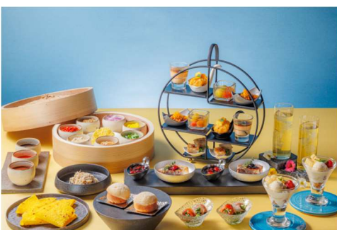
都シティ 大阪本町 モダンチャイニーズブラスリー「HALOW」