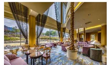
都ホテル 岐阜長良川