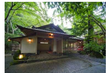
奈良・春日奥山 月日亭