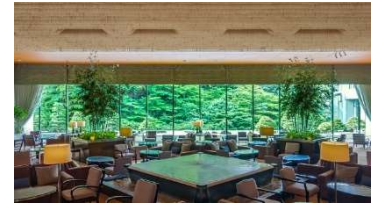
シェラトン都ホテル東京