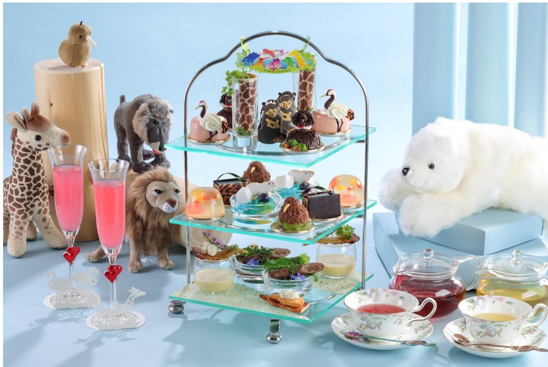
レストラン&ラウンジ・バー eu (ゆう) 「アニマル アフタヌーンティー ～天王寺動物園×シェラトン都ホテル大阪～」

<本件に関する報道関係各位からのお問い合わせ先> シェラトン都ホテル大阪 マーケティング部 〒543-0001 大阪市天王寺区上本町 6-1-55 TEL：06-6773-6047 FAX：06-6773-3322