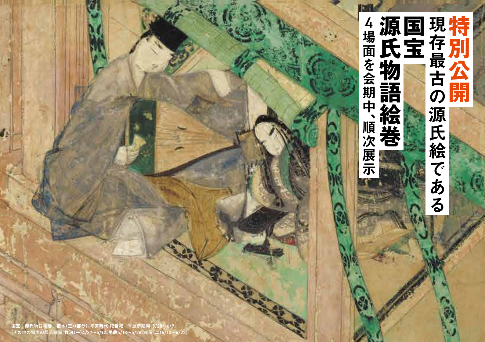
国宝 源氏物語絵巻 宿木(三) (部分)、平安時代 12世紀 ※展示期間: 5/28~6/9 (その他の場面の展示期間: 竹河(一) 4/27~5/12、早蕨5/13~5/26、東屋(二) 6/10~6/23)