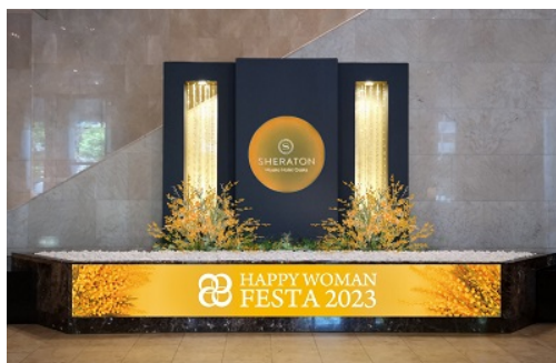
写真は2023年のものです。

■HAPPY WOMAN®はパートナーシップで持続可能な開発目標（SDGs）を支援する活動です。