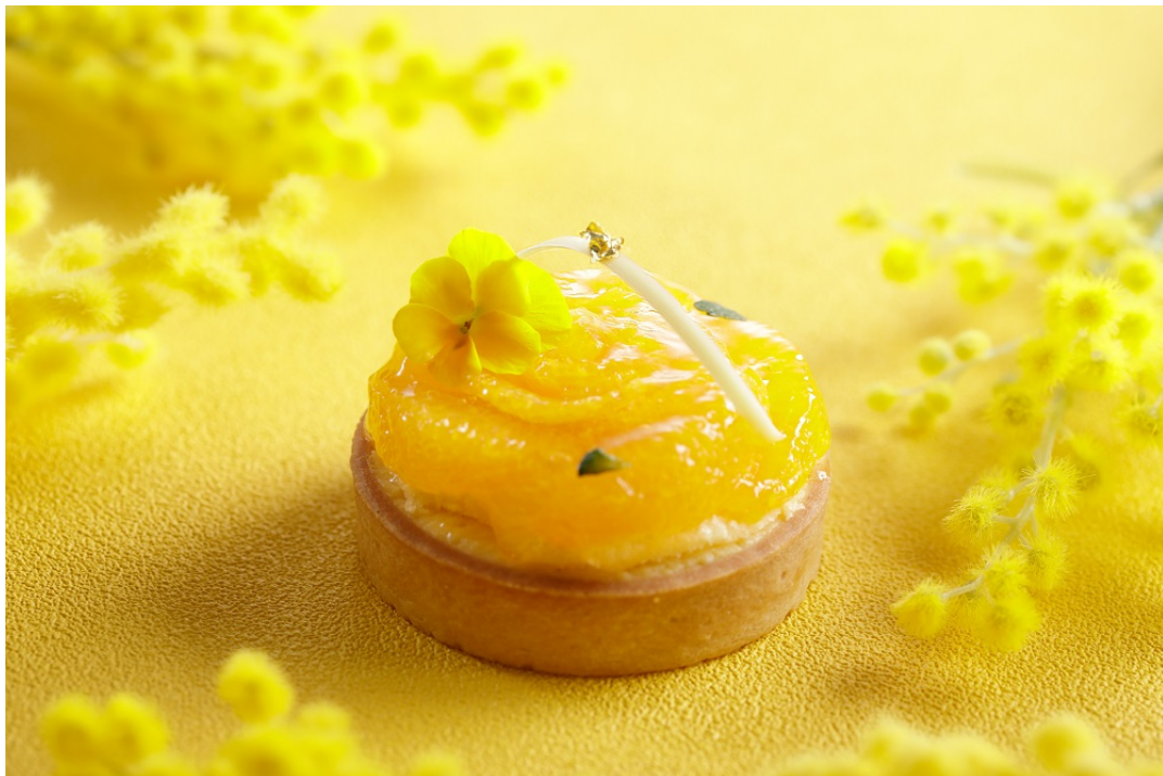
カフェ&グルメショップ カフェベル “MIKAN”タルトレット

<本件に関する報道関係各位からのお問い合わせ先> シェラトン都ホテル大阪 マーケティング部 〒543-0001 大阪市天王寺区上本町 6-1-55 TEL：06-6773-6047 FAX：06-6773-1097