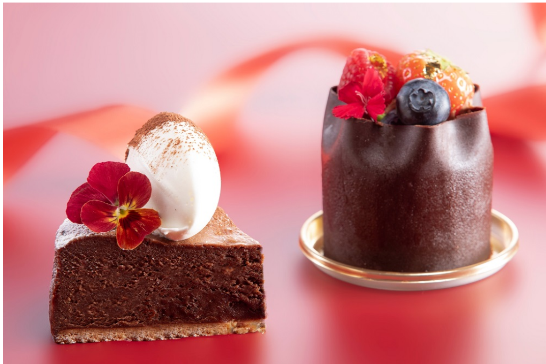
カフェ&グルメショップ カフェベル （写真左から）ガトーショコラ、ショコラブーケ

<本件に関する報道関係各位からのお問い合わせ先> シェラトン都ホテル大阪 マーケティング部 〒543-0001 大阪市天王寺区上本町 6-1-55 TEL：06-6773-6047 FAX：06-6773-1097 E-mail: y-oba@miyakohotels.ne.jp