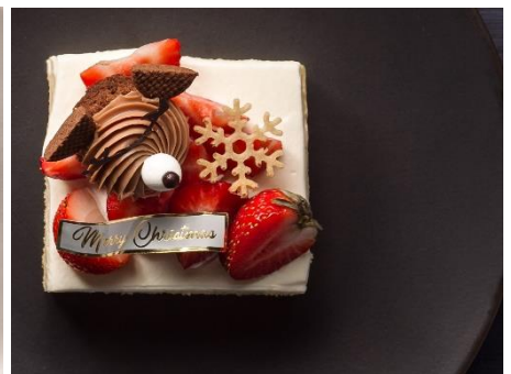
ダブルチーズケーキ