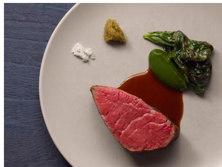
和牛フィレステーキ、ジュードヴィアンド、 ほうれん草