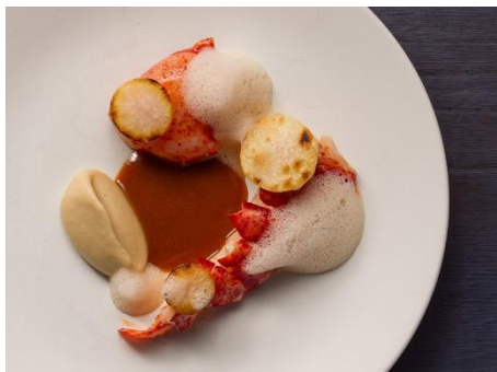
オマールソテー、アメリカーナ、菊芋