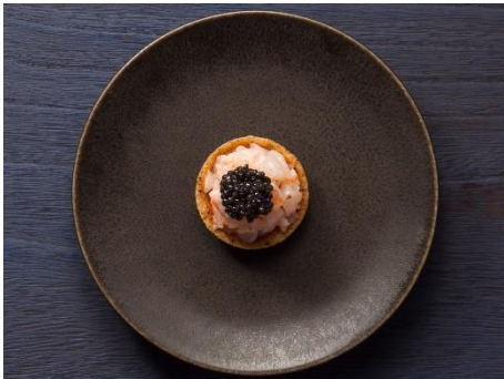
キャビア、薩摩赤海老、黄柚子のタルト