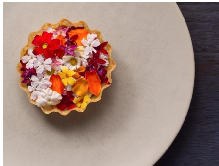
奥日向サーモントラウトと燻製オイル クリスピータルトレット