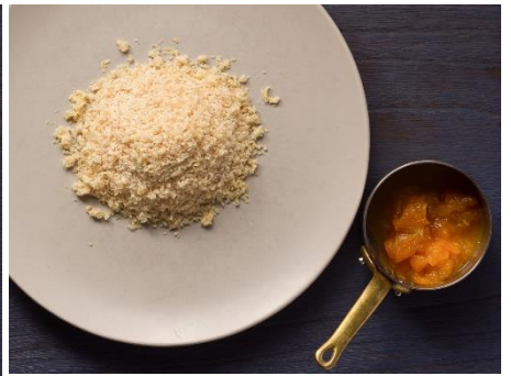
フォアグラテリーヌとみかんの コンフィチュール