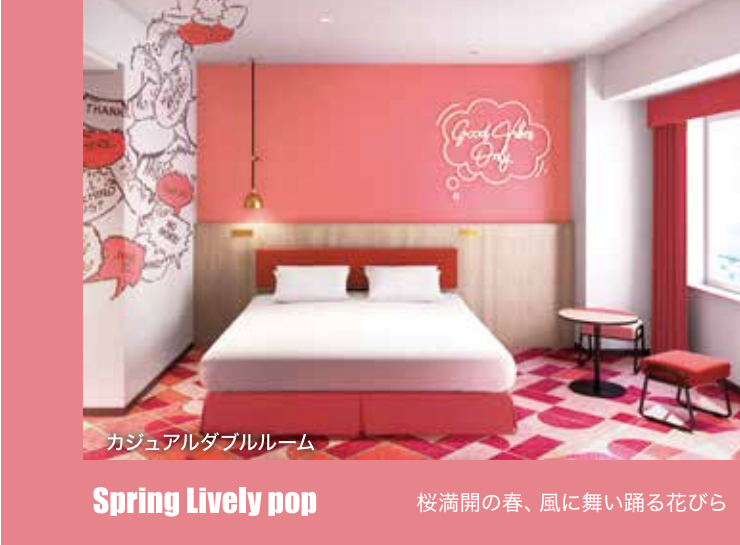
カジュアルダブルルーム Spring Lively pop 桜満開の春、風に舞い踊る花びら

JR新大阪駅 … JR (京都市線・環状線・ゆめ咲線) にて ユニバーサルシティ駅まで約20分 JR大阪駅 … JR (環状線・ゆめ咲線) にてユニバーサルシティ駅まで約12分 大阪国際空港 (伊丹) … 空港リムジンバスで約45分 (ユニバーサル・スタジオ・ジャパン発着) 関西国際空港…空港リムジンバスで約70分 阪神高速湾岸線の北港JCTを分岐し、ユニバーサルシティ出口 … 車で約5分