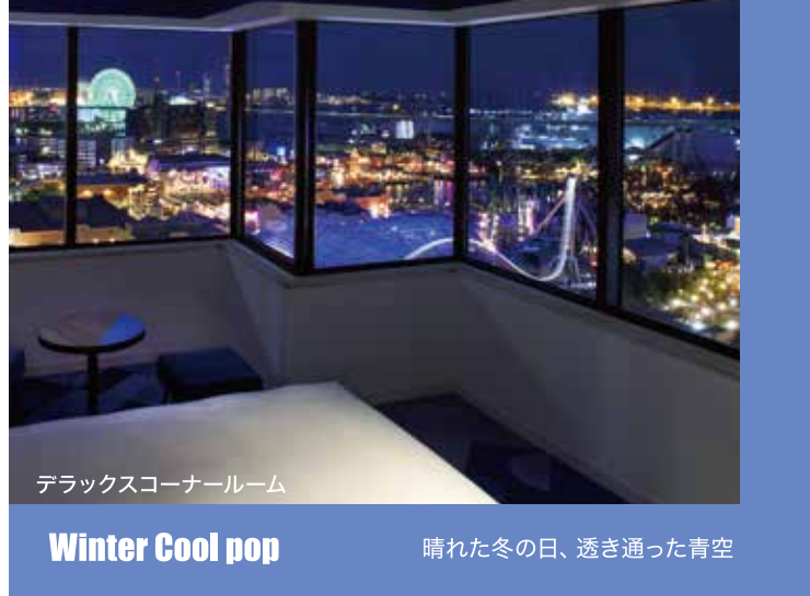
デラックスコーナールーム Winter Cool pop 晴れた冬の日、透き通った青空