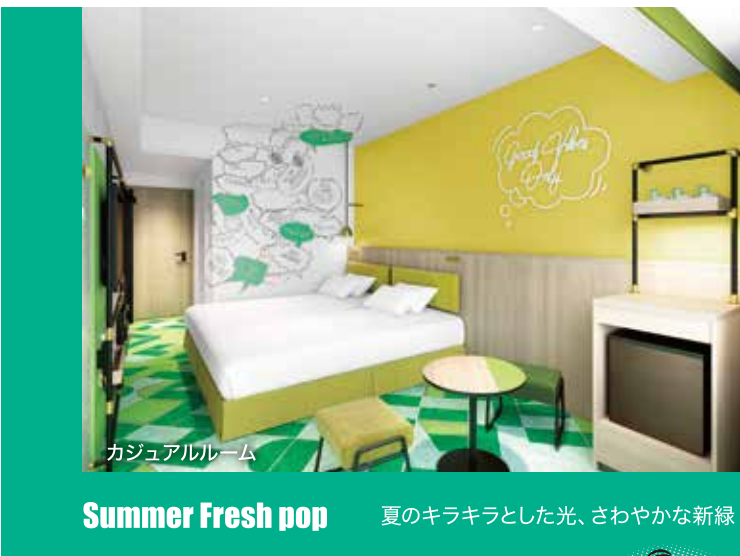
カジュアルルーム Summer Fresh pop 夏のキラキラとした光、さわやかな新緑

フロアごとに色彩をモチーフにしたコンセプトで統一しており、色で日本の四季・春夏秋冬も表現しています。