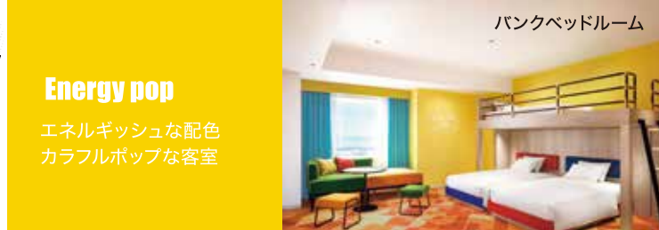
バンクベッドルーム Energy pop エネルギッシュな配色カラフルポップな客室

Point ホテルを出れば、すぐゲート！ パークまで徒歩約1分の近さで、利用しやすさ抜群。