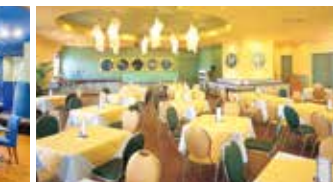
5F OPS (オプス)