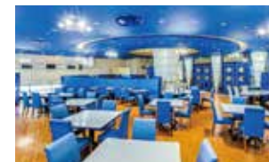
4F SOL (ソル)

4 5 ファンクションルーム 多目的に使える会場です。美味しいお料理を囲んでのパーティや会議やミーティングなどにもご利用いただけます。