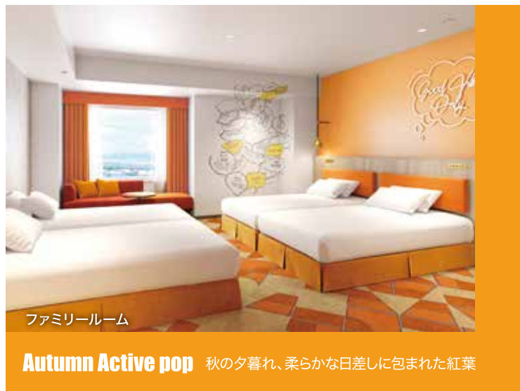
ファミリールーム Autumn Active pop 秋の夕暮れ、柔らかな日差しに包まれた紅葉