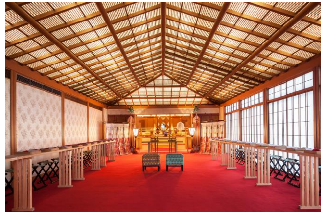
3階 神前式場 福寿殿