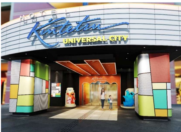
エントランスイメージ