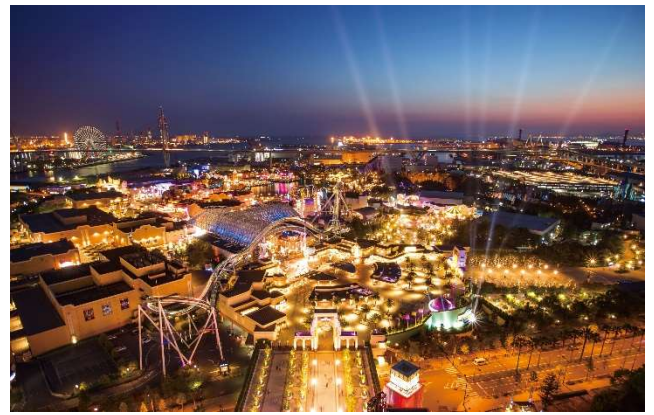
スタジオビュールームからの眺め（写真はイメージです）

また、ご家族での旅行時にも快適にお過ごしいただけるようにと、バンクベッド（2段ベッド）タイプや最大5名まで宿泊可能な客室、洗い場付きのバスルームも新設し、家族やグループなど様々なニーズでの旅行に可能な客室を拡充します。