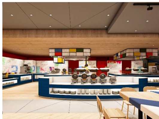
レストラン「イーボック」イメージ