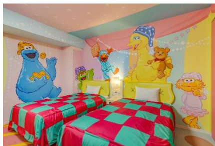
セサミストリート・パジャマパーティ・ルーム