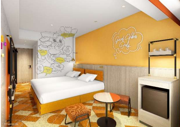
カジュアルルーム