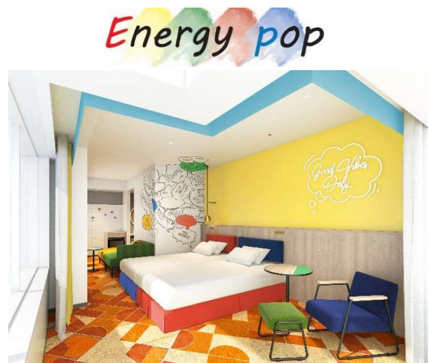
エナジーポップ コーナーファミリールーム

本改装で、新たに「Energy pop ルーム」という、エネルギッシュな配色でカラフルポップな客室をご提供します。ぜひこちらもご期待ください。