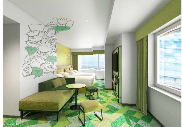
コーナーファミリールーム