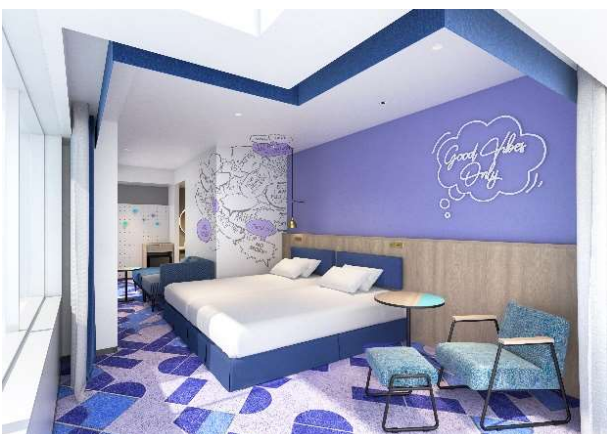
デラックスコーナールーム