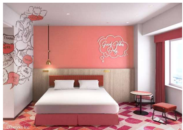
カジュアルダブルルーム