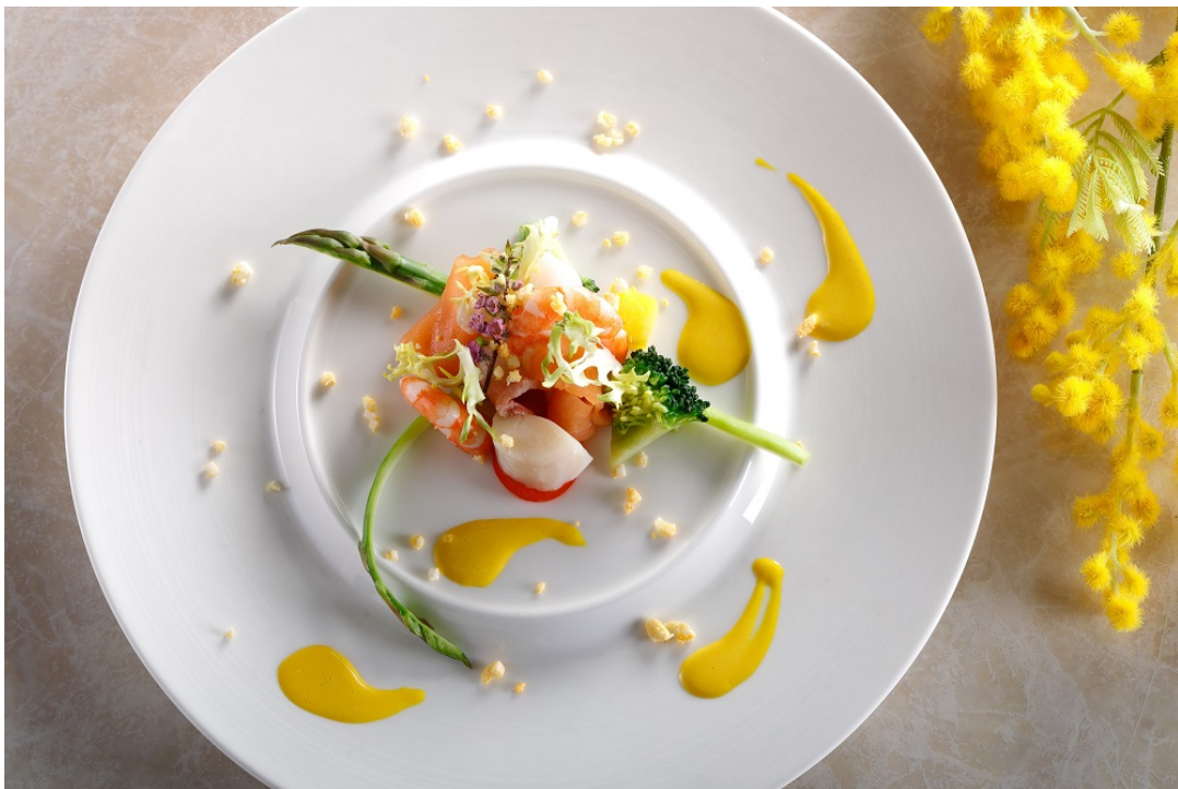
レストラン&ラウンジ・バー eu (ゆう)「ミモザランチ」

<本件に関する報道関係各位からのお問い合わせ先> シェラトン都ホテル大阪 マーケティング部 〒543-0001 大阪市天王寺区上本町 6-1-55 TEL : 06-6773-6047 FAX : 06-6773-1097