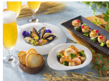
都ホテル 尼崎 スカイバー トップ・オブ・ザ・クリスタル ブルーシーフードを使った一品