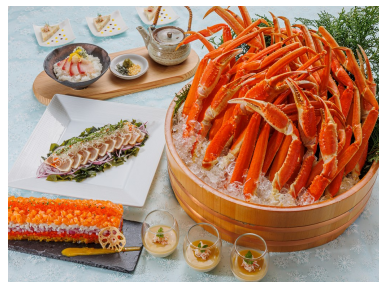
都シティ 大阪天王寺 スカイレストラン エトワール 本ズワイ蟹食べ放題付きbuffet