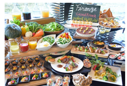
都ホテル 岐阜長良川 コンチネンタルレストラン フィレンツェ HALF&オーダーbuffe