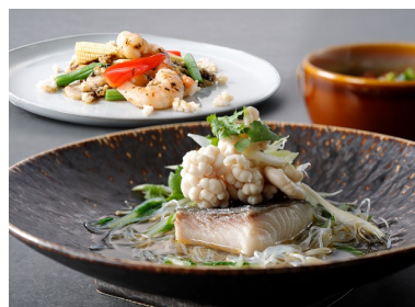
都シティ 大阪本町 モダンチャイニーズブラッセリー HALOW(ハロウ) オーガスタコース