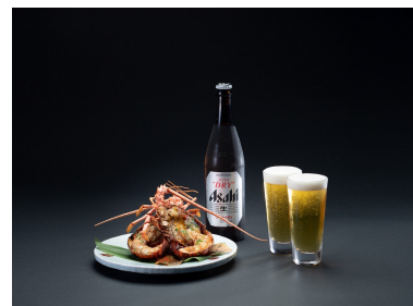
都リゾート 志摩 ベイサイドテラス イグレック志摩 伊勢海老料理（伊勢海老の鬼殻焼き）と スーパードライコンビネーション