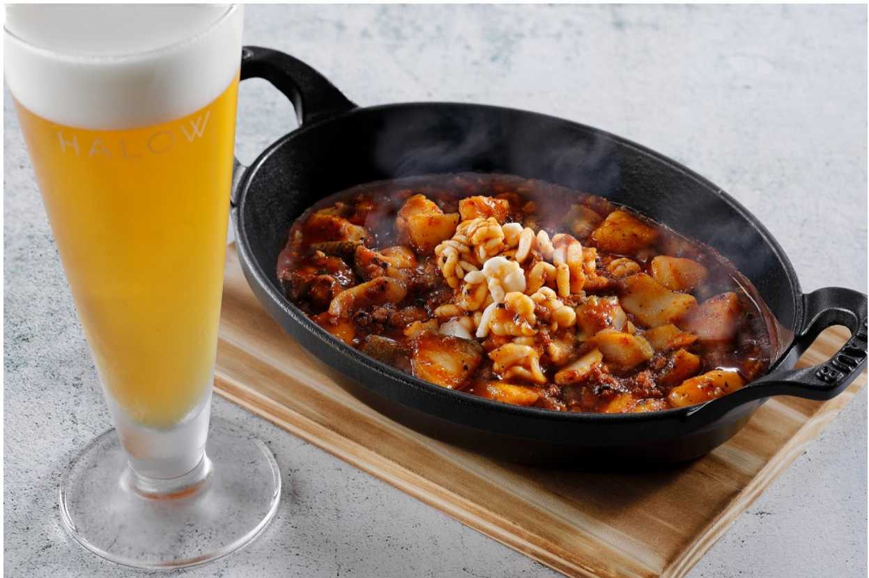
都シティ 大阪本町 モダンチャイニーズブラッセリー HALOW(ハロウ)