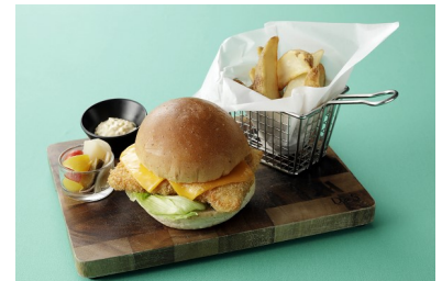
大阪マリオット都ホテル BAR PLUS メカジキとタルタルソースのフィッシュバーガー