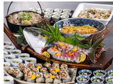
都リゾート 奥志摩 アクアフォレスト レストラン はまなぎ ディナーbuffet