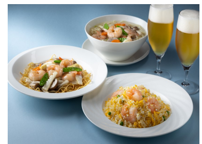
シェラトン都ホテル東京 中国料理 四川 蝦仁湯麺・蝦仁炒飯・蝦仁炒麺