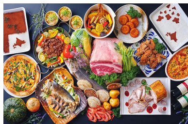
都ホテル 京都八条 バイキングレストラン「ル・プレジール」 北海道ディナーbuffet