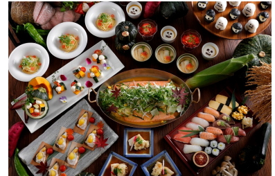
ウェスティン都ホテル京都 オールデイダイニング「洛空」 ランチ・ディナーbuffe