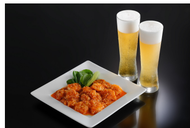
都ホテル 四日市 中国料理 四川 小海老のチリソース