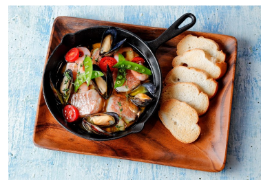
ホテル近鉄ユニバーサル・シティ カジュアルレストラン イーボック ブルーシーフードを使った一品