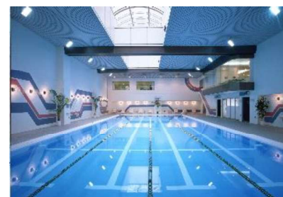
都ヘルスクラブ プール