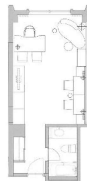
サービスオフィス（36㎡）