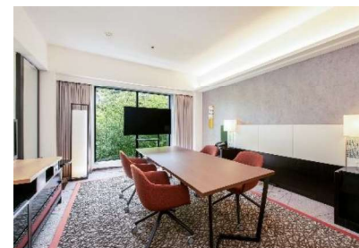
ご契約者様専用ミーティングルーム

【設備】インターネット環境 / TVモニター / Web会議用カメラ / マイクスピーカー