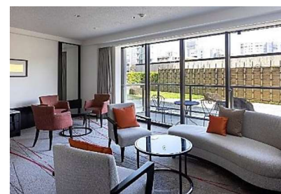
ご契約者様専用ラウンジ