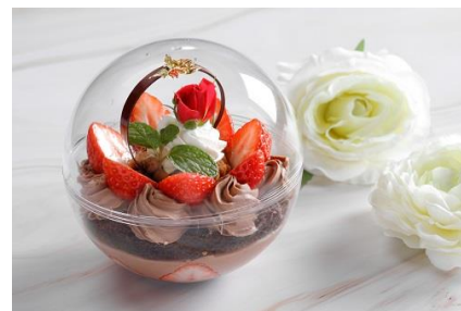
スイーツ スフィア ～Valentine's Day～

3月限定のホワイトデーバージョンは、なめらかな食感でミルキーな味わいのホワイトチョコレートクリームに甘酸っぱくてジューシーないちごを合わせたやさしい甘さのケーキです。