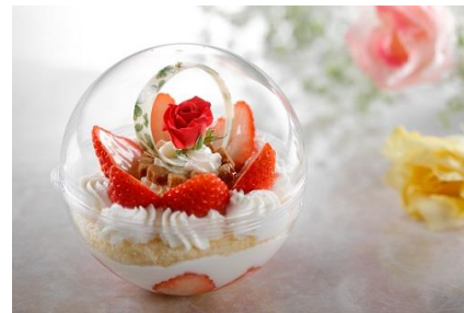
スイーツ スフィア ～White Day～

【販売期間】 バレンタインバージョン：2022年2月1日（火）～2月28日（月）