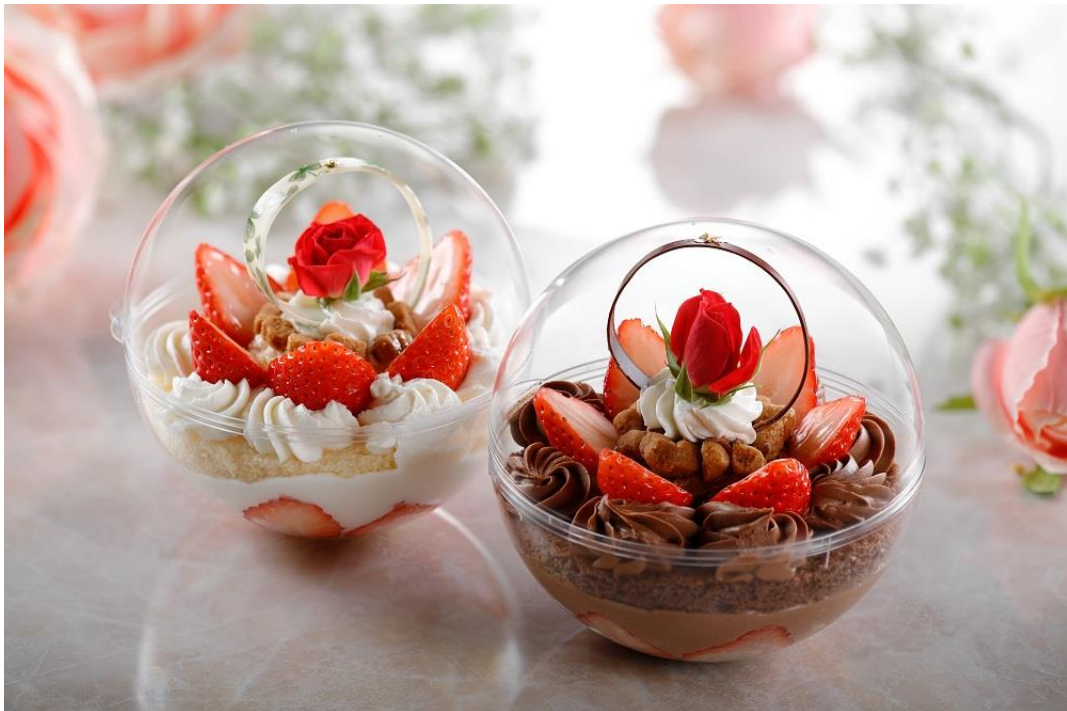
(写真左から) スイーツ スフィア ～White Day～、スイーツ スフィア ～Valentine's Day～

<本件に関する報道関係各位からのお問い合わせ先> シェラトン都ホテル大阪 マーケティング部 〒543-0001 大阪市天王寺区上本町 6-1-55 TEL：06-6773-6047 FAX：06-6773-1097