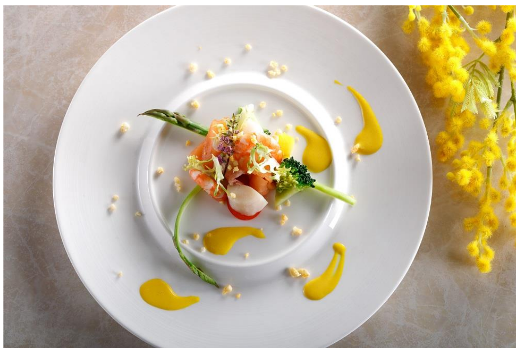
レストラン&ラウンジ eu (ゆう)「ミモザランチ」

<本件に関する報道関係各位からのお問い合わせ先> シェラトン都ホテル大阪 マーケティング部 〒543-0001 大阪市天王寺区上本町 6-1-55 TEL：06-6773-6047 FAX：06-6773-1097