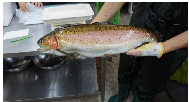
多気サステナブルサーモン