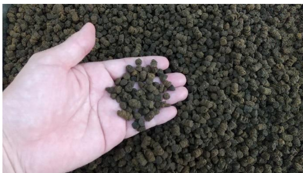
多気ブランド飼料

養殖方法：陸上養殖 閉鎖循環式（多気町）、地下水かけ流し式（石井養殖(岐阜県大垣市)）