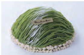
5月1日(日) 伊勢茶のモンブラン ¥3,500