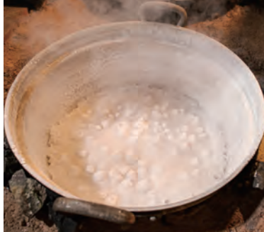
炊き上がった塩は「塩の花」が咲くと表現される