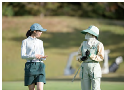
キャディさんにコースの特徴などを教えてもらいながらラウンド