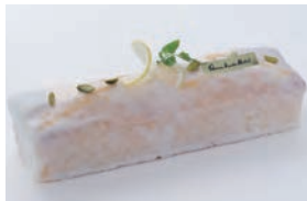
3月6日(日) 南伊勢産レモンのケーキ ¥3,500

総料理長 樋口宏江が監修する季節のお菓子。三重の豊かな食材、季節や自然の恵みに感謝の気持ちを込めて「おつたち」と名付けました。毎月、旬の素材をテーマにしたお菓子をご用意いたします。