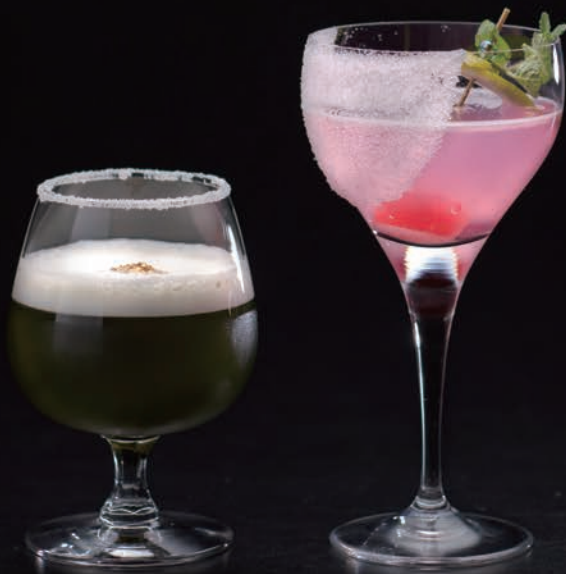
左:香塩茶 右:揚羽蝶

塩と柑橘は、カクテルでは相性の良い組み合わせ。今回は竈方の塩づくりに感銘を受けた川口チーフバーテンダーがオリジナルカクテルを考案しました。