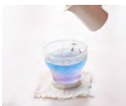
サービスでいただける バターフライビーティー