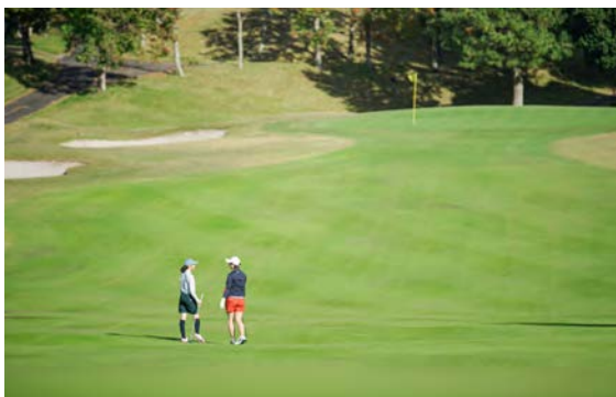
写真上: 思わず歓喜があがる瞬間 写真下: ホテルのゲストラウンジで過ごす楽しい時間