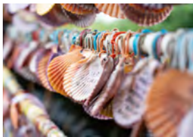
カラフルな檜扇貝の貝殻の絵馬