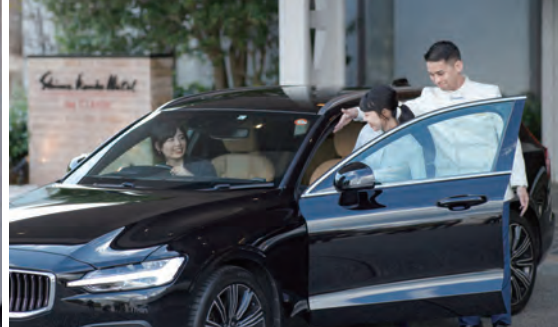
ゴルフウェアでホテルを出発