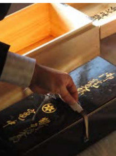
系図や製塩に用いた薪を切り出す山の権利などが書かれている御証文

伊勢の南の玄関口である南伊勢町はリアス海岸沿いに38の集落が点在しています。その中で「竈」という漢字が使われている7つの集落は竈方集落と呼ばれ、源平合戦の後に移り住んだ平家の子孫が暮らしています。子孫の証である御証文には、竈方共有の財産である山の権利や由来が書かれており、今も八ヶ竈八幡神社で、厳肅な御証文の受け渡しの儀式が行われています。竈方集落は海沿いにあるものの平家が開いた集落で漁業権を持たなかったため、約400年前までは塩作りなどで生計を立てていました。「竈」という字は塩を炊く竈を意味します。