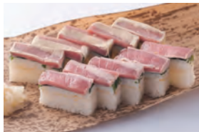
2月13日(日) 伊勢まぐろの押し寿司 ¥5,000

和食総料理長 塚原巨司が三重の様々な食材を目にも楽しく、味わい深い押し寿司、棒寿司に仕上げました。