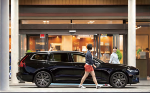
ゴルフ場はホテルからの距離も近くスムーズにチェックイン