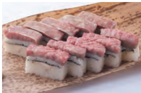
3月13日(日) 松阪牛の押し寿司 ¥6,000