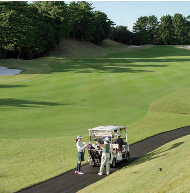
広いフェアウェイが特徴的