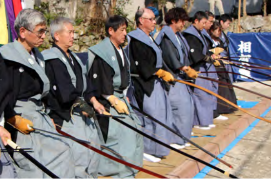
龍方祭での引き神事の様子