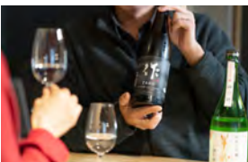
カウンターでテイasting