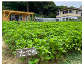
染料の材料となるたで藍も自家菜園で栽培