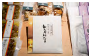
真珠貝貝柱の酒粕漬け