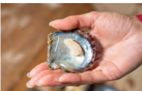
地元で食される真珠貝貝柱