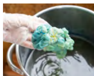
自家製染料で浸けること5分