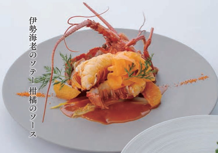
伊勢海老のソテー 柑橘のソース