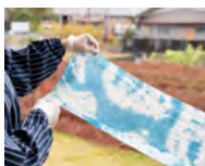
美しい模様仕上がる