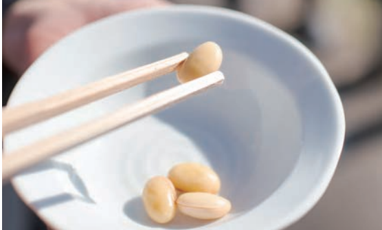
試食させていただいた大粒の嬉野大豆