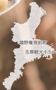
嬉野権現前町 志摩観光ホテル