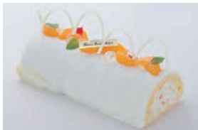
4月3日(日) 三重柑橘せとかとショコラブランのムース ¥3,500