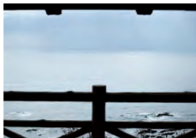
水平線を望む太平洋の眺め