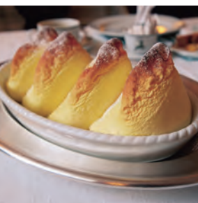
ザルツブルガーノッケルン

て栄え、現在はユネスコの世界遺産にも指定されている。そうした貴族たちの影響もあり、ザルツブルグにはヨーロッパの上流階級を魅了したお菓子が数多く生まれた。取材中に私が気に入ったのは「ザルツブルガーノッケルン」である。これは、卵白に塩を加えて泡立てたメレンゲと牛乳やバター、砂糖と小麦粉を使ってふんわり仕立てたスフレのようなお菓子である。ザルツブルグの山のように、こんもり仕上げるのが流儀である。見た目の迫力と、意外なほど軽やかな食後感、クセになる味わいなのである。