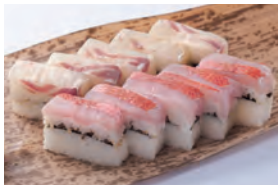
4月10日(日) 金目鯛と伊勢まだいの押し寿司 ¥5,000