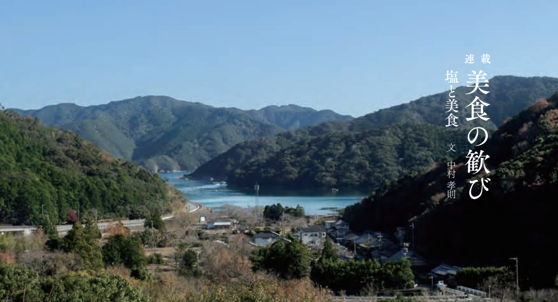
塩づくりが行われている南伊勢町棚橋壺集落

モーツアルトの生まれ故郷でも知られるオーストリアのザルツブルグは塩が繁栄をもたらした街である。ザルツ(SALZ)は塩、ブルグ(BURG)は砦という意味を持ち、この付近で岩塩が産出されたことに由来する。中世の時代、塩は「白い金」とも呼ばれ貴重であったことから、中欧の交通の要所であるザルツブルクは、塩を背景に巨万の富と権力を手にしたのである。私はかつて音楽祭の取材でこの街を訪ね、郊外にも足をのびした。この街の周辺には、塩の御料地を意味する、ザルツカンマーグートと呼ばれる風光明媚なエリアがある。この周辺の岩塩鉱がハプスブルク帝国の直轄地であったことから貴族たちの保養地とし